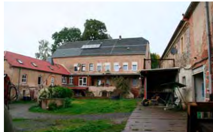
Blick auf das Wohnhaus

Der Anfang war schwer. Zuerst wurde nur ausgebessert, repariert, die Dächer abgedichtet und aufgeräumt. In monatelanger Arbeit wurden die fingerdicken Kalkschichten von den Ziegeln entfernt. Viele Helfer gab es in den Jahren, die uneigennützig ein paar Wochen oder auch Monate kräftig mit anpackten. Aus den Balken und Brettern einer schweren, zum Abriss stehenden Holzbrücke beispielsweise, die die Männer des „MC“ in einer Eilaktion abgebaut und weggeschafft hatten (bevor es jemand anderes tat) bauten sie eine lange Veranda in den Innenhof des Guts. Im Sommer überdacht sie nun eine Bar mit gemütlichen Sitzplätzen.