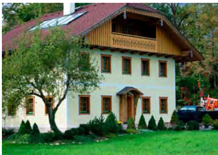
Wohnhaus, Werkstatt und Ausstellungsraum der Leithners

Hier bauen sie auf Bestellung Tische, Stühle, Schränke, Kommoden, und sehr aufwendige Raumausstattungen mit dazu passenden Decken- und Wandverkleidungen, alles mit handgeschnitzten Verzierungen. Schlafzimmer aus Zirbenholz sind derzeit besonders beliebt, da diese Holzart über einen Zeitraum von bis zu 100 Jahren stetig ätherische Öle absondert, die mit ihrer beruhigenden