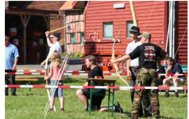
Freies Training für Axt und Bogen