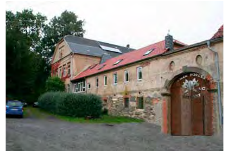
Ein großes Holztor mit dem Logo des Motorradclubs „Dark Forces“ öffnet den Weg in den Innenhof des Rittergutes.