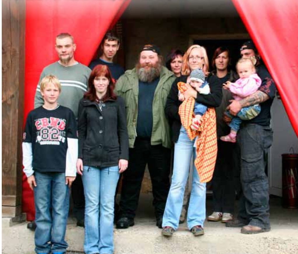
Mit Mut und Ausdauer widmet sich die ganze Familie ihrem gemeinsamen Projekt