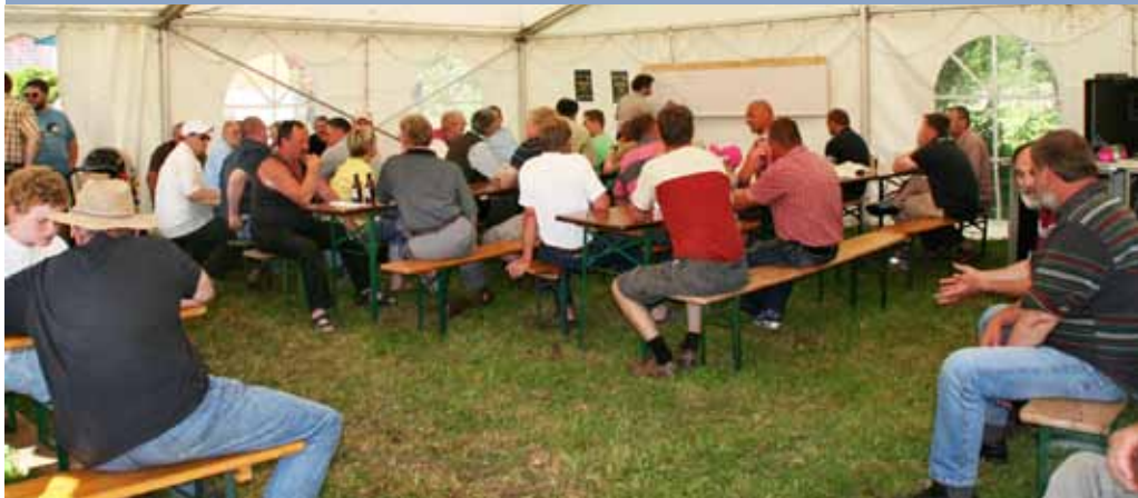
Fachwissen und Erfahrungen teilen, das war das neue Konzept beim Wood-Mizer Seminar.

dabei sind und noch erst wenige Meter gesägt hatten. Insgesamt waren wohl um die 100.000 gesägte Festmeter bei den 60 versammelten Sägern im Zelt beieinander. Schon auf die Frage was ein gerader Schnitt, oder was tolerierbar ist, gab es die Antwort: „kommt darauf an“. Zum einen wie oft eine Welle entsteht, zum anderen bei welchem Produkt. Einmal am Tag vor dem Bänderwechsel ist eine kleine Welle sicher akzeptabel, kommt es öfter vor wird es kritisch. Aber auch Sichtbarkeit und Verwendung der gesägten Ware ist von Bedeutung, bei einer unbesäumten Bohle, die vielleicht noch gehobelt wird ist es nicht so schlimm, bei Sichtkantholz fällt jede Welle stark ins Auge. Relativ übereinstimmend wurde eine Welle von 1- 1,5 mm als akzeptabel bezeichnet, bei 7mm Lamellen höchstens 0,5mm. Die Frage: „Was ist schwieriges Holz“ wurde sehr unterschiedlich beantwortet. Übereinstimmend wird halbtrockene oder trockene Käferfichte als schwierig bezeichnet, ebenso wie stark astige Randbäume. Gefroren geht die Fichte besser, die Kiefer dagegen schlechter. Kritisch sind große Durchmesser, speziell wenn dann ein Kerntrennschnitt gemacht werden muss. Bei trockenem Weichholz wie Pappel gibt es riesen Unterschiede zu frischem Holz. Und Bäume aus höheren Berglagen schneiden sich wegen der