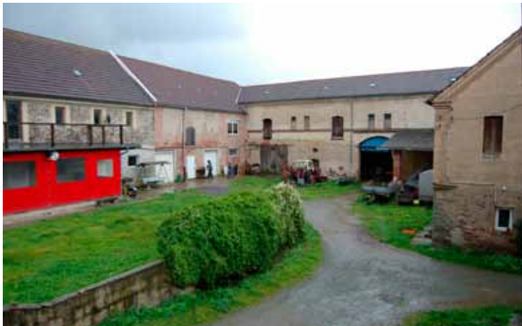
Blick vom Wohnhaus, links ist das Clubhaus der „Dark Forces“ mit der „Brücken-Veranda zu sehen.

Da man in den historischen Mauern kein Holz mit Standardmaßen verarbeiten kann, mussten sie viel Holz teuer und aufwendig sägen lassen. Oft tritt aber erst während des Bauens zutage, dass auch noch das ein oder andere Brett zusätzlich gebraucht wird, was dann ärgerliche Baustopps zur Folge hat. Eine eigene Säge, so war der Schluss, wäre die ideale Lösung - einfacher,