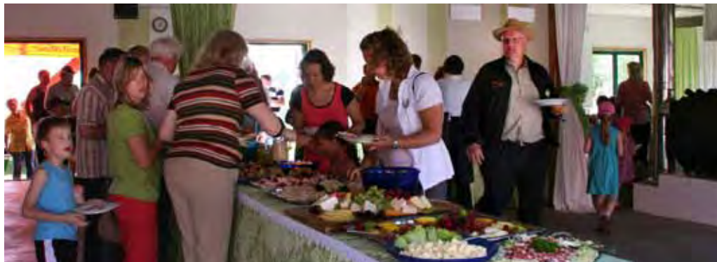
In den neuen großzügigeren Räumen gab es kein Gedrängel am wie immer „handgeschnitzte“ Buffet.

98 Sägebesitzern waren es über 280 Besucher. Wie immer freuen wir uns über rechtzeitige Anmeldung, denn sonst kann es passieren, dass die schönsten Sachen vom Buffet zu schnell verschwinden. Ein Großteil der Veranstaltung spielte sich auf der Wiese hinter der Werkstatt ab, wo es genügend Platz gab für das Seminarzelt, das Bungee-Trampolin, den Axtwurf, das Bogenschießen, für die Cocktails und den Bierwagen. Da das Treffen während der Fußball WM stattfand, gab es nicht nur die Möglichkeit ein Viertelfinalspiel auf der Großleinwand zu sehen, auch zwei auf der Wiese aufgestellte Tore luden viele