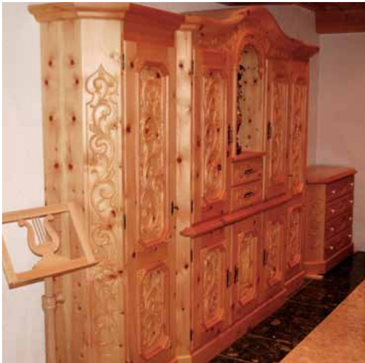
Die einzigartigen Möbelstücke sind mit aufwändigen Schnitzereien verziert